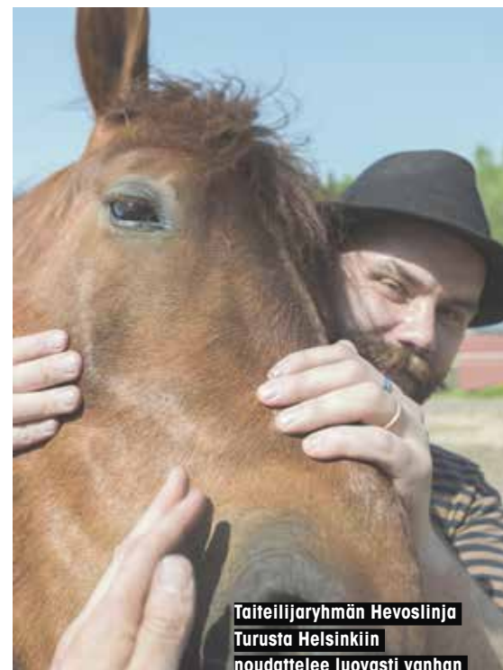
Taiteilijaryhmän Hevoslinja Turusta Helsinkiin noudattelee luovasti vanhan Kuninkaantien polveilemistä modernissa maastossa.

Hevoset ovat onnistuneet keräämään ympärilleen omistautuneita harrastajia, joille raviratojen varikot tai lähiöiden ratsastustallit